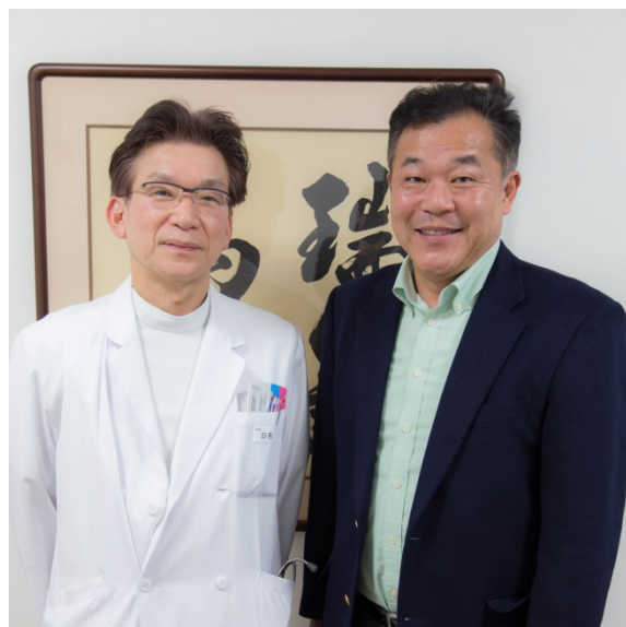
日名理事長（左）と小橋社長（右）

日名理事長：ありがとうございます。患者様の期待に応えられるよう、少しずつですが「病院化（病床数 20 床以上）」を目指して努力しています。