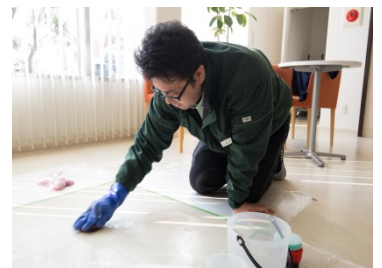
事前テストで床材と汚れ落ちを確認

喜び以上の感動を創る」ために、当社は小さなことを大切にしています。例えば、床清掃であれば、「床材に適した清掃方法の選択」です。入念な事前テストを行い、不測の事態ができるだけ起こらないよう、安心して予定通りの作業ができるようにしています。お客様の目には「仕上がりの良し悪し」しか映りませんが、当社は、手間暇をかけても「 お客様の目に見えない部分 」に目配り・気配りをする