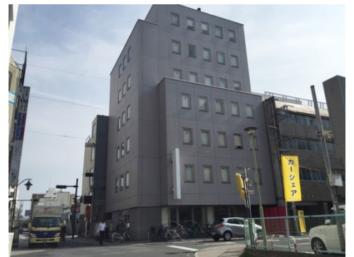
岡山駅前にある KLab 岡山事業所オフィスビル