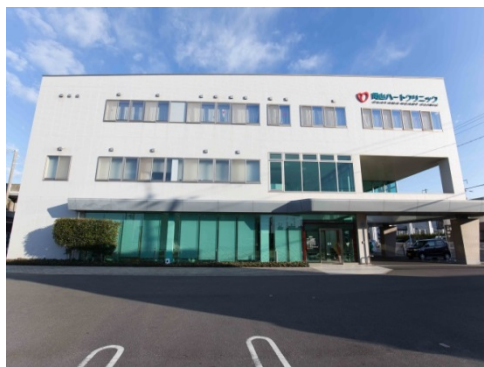
7 周年を迎える岡山ハートクリニック

小橋社長：今回当社に施工のご依頼をいただき、ありがとうございました。「美観維持」についてはどのようにお考えですか？