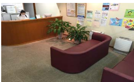
温かい雰囲気でお客様を迎えます

そんな優しさと温もりを感じる心療内科専門クリニックが「さかいクリニック」です。患者様に少しでもリラックスした空間を提供したいということで、院内のカーペットとエアコン清掃、そして共用部廊下の床清掃のご依頼をいただきました。