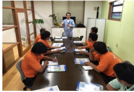
「人財」を育てるための定期的な研修会