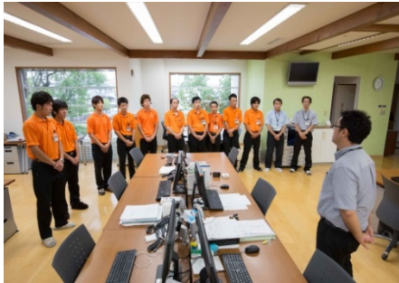
業務開始前の正確な周知伝達が生命線

当社の事業は、「サービス業」です。どれだけ機械や道具が優れていても、関わる人間（スタッフ）の「知性や良識、そして心」が伴っていただければ、お客様に感動していただくことはできません。当社は20代・30代中心の若手スタッフが現場で活躍しています。感動を創る「人財」を育てることに、全社を挙げてチャレンジし続けています。