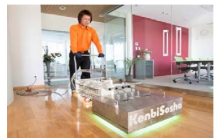
「温度・湿度・時間」に厳密さが求められる特殊な床コーティング技術

どの業界でも技術は日進月歩で進みます。当社は国内外からお客様に喜ばれるものを探し、いち早く導入します。ただ、これは口で言うほど簡単なことではありません。まずその知識を十分理解し、施工技術の習得をしなければなりません。手先の技術だけでなく、建物の状態（温度・湿度等の環境要素）に留意し、時間の正確さも求められます。試行錯誤を繰り返しながら、最先端で唯一無二のサービスを習得していきます。