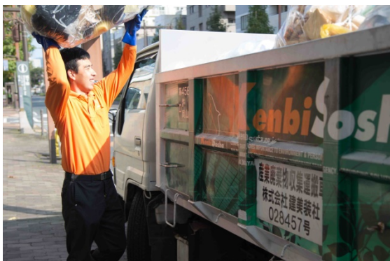
安心と清潔をお届けする当社スタッフ

「ごみの不法投棄の問題が時々ニュースで話題になることがありますが、不法投棄するのは業者であっても、ごみを出した側（自社）の責任も問われます。信頼できる会社はどこだろう？と考えた時、長年貯水槽清掃でお世話になっている建美装社さんなら安心して任せられると考えました。営業担当の方もできることとできないことを明確に答えてくださり、他社での事例なども教えてくださる等、対応も早くて信頼できたことが大きかったです。実際に業務を始めてからも、作業スタッフの方がゴミ置き場をととても綺麗な状態に保ってくれていますし、物音を立てず静かに素早く作業をしてくれるのも本当に助かっています。」