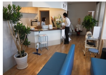
ウィナップ施工後（開院前）の院内の様子

今回施工させていただいたのは、当社自慢の床コーティング「ウィナップ」です。紫外線硬化型の樹脂ワックスで、従来のワックスとは全く異なる超光沢・超耐久を実現する特殊コーティングです。患者様は土足のまま来られるようなので、毎日の清掃がとても大変です。しっかりとしたコーティングを施すことで、少しでも長く美しい状態を維持できます。これからも様々なサービスを通じて、のざきクリニックを応援させていただきます。