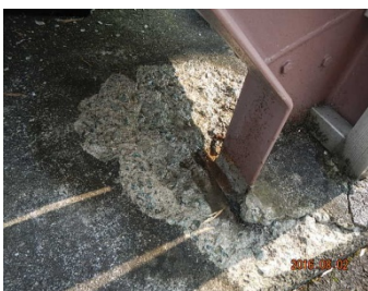
階段下の破損（修繕前）

こうした当社のポリシーや強みによって、熊本が少しでも早く復興できるように支援を続けると同時に、当社に関わってくださるすべてのお客様の期待に応え続ける企業でありたいと思っています。