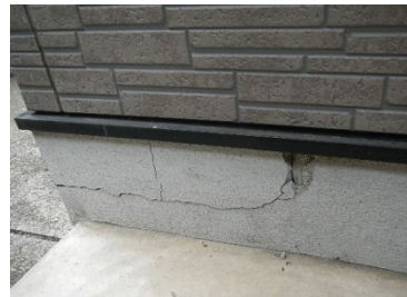
アパート基礎の破損（修繕前）