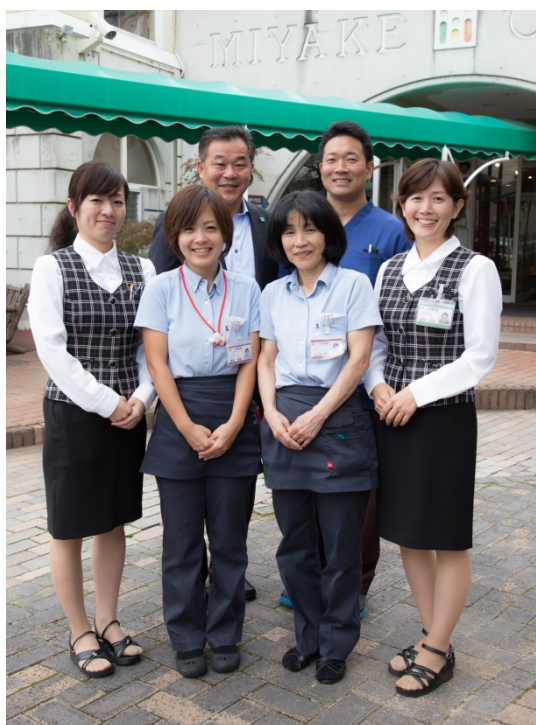
三宅理事長・小橋社長を笑顔で囲む職員の皆さん

岡山市南区大福で婦人科・乳腺外科・内科・眼科、そして健康診断（人間ドック）まで幅広く診療を行なっている「岡山大福クリニック」の日常清掃業務を当社にお任せいただくことになり、10月17日より本格始動しました。