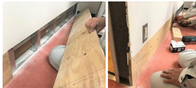
傷部分を切り取り、ベニヤ板をはめ込む