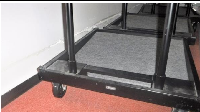
壁に台車の高さの一直線の傷

当社では、このような お客様のニーズ に合わせた工事を行っております。お気軽にお問い合わせください。