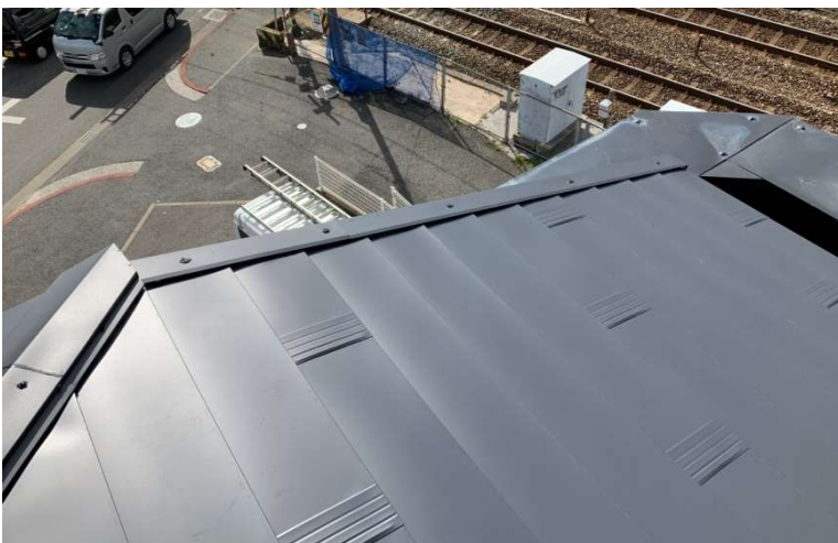
当社施工「カバールーフ工事」完工写真 平坦で見た目も良く、スタイリッシュな仕上がりに

カバー工法でコストダウン&スピーディーに！ ガルバニウム鋼板を使用し、屋根・外壁のリフォームをしませんか？ 屋根・外壁は雨風から建物を守る大切な役割があります。その為、適時メンテナンスが必要になってきます。 外壁を塗り替えたり、既存の屋根材を剥がして葺き替えをするリフォームを行うことで建物の価値を持続し高めていくことになりま