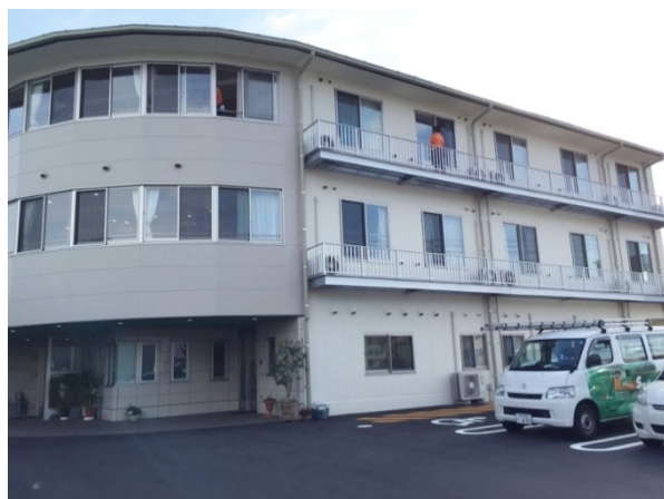
小野医院の隣の敷地に新設した「ケアホームきずな」

「新しい事業をスタートしたとはいえ、分からないことだらけです。」というお客様の不安や悩みに、これからも丁寧にお応えしていきたいと思ひます。