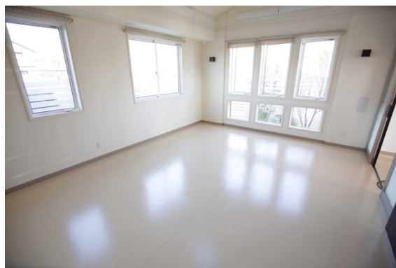
ウイナップ施工後にさらに輝きを増したフロア