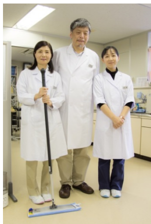
結縁院長と職員の方々

「よりレベルの高い清掃品質」を求めて、当社にお声掛けいただいたのは、KSB（瀬戸内海放送）会館内にある難聴・めまい専門のクリニック「ゆうえん医院」です。院長の結縁先生はとても気さくな方で、これまでの清