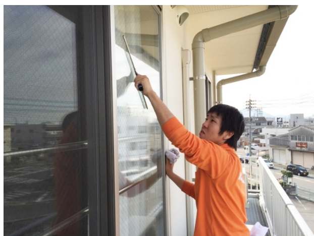
ご利用者様に迷惑にならないよう、素早い作業を行います

ご利用者様は高齢者ですので、特に室内に入る作業には細心の注意を払います。お客様と綿密な連携を図りながら、現場責任者の指示のもと、若手スタッフが機敏に動きます。病院清掃も経験しているスタ