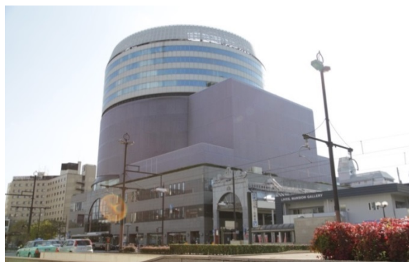
岡山市のシンボルとして 25 周年を迎えるシンフォニーホール