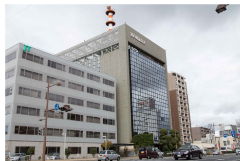
KSB 会館（3F）にある「ゆうえん医院」

結縁先生に限らず、どのお客様にとっても「少しでも患者様や来客者、そして職員（社員）にとって快適な空間を維持したい」という思いは強く、当社としてもそれぞれのお客様のご希望に沿ったご提案をさせていただいています。当社サービスの中で「ファインコート」は、皆様のご期待以上の結果を実感していただける床コーティング剤です。ピカピカになった床で、これからも患者様を笑顔で、温かく迎えていかれることでしょう。