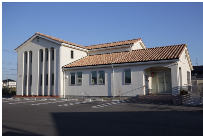
洋風デザインが特徴的な岡崎内科クリニック

からスタートし、「アンダーコート（下地剤）」を塗布し、乾燥を待って「トップコート」を丁寧に塗り重ねます。そして乾燥後に「紫外線照射器」を用いて樹脂を硬化させます。ここまでにかかる時間は最低でも7時間。その一つ一つの作業には精密な施工技術が必要です。それだけに仕上がりの美しさと耐久性は従来のワックスとは格段の差があります。有機溶剤を使用しない天然成分だけの特殊ワックスですので、患者様にも、職員の皆様にも安心空間を提供できます。