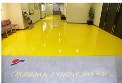
床を甦らせる「ファインコート」