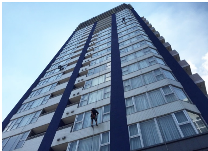
岡山市北区表町にある高層マンション「ライオンズタワー岡山表町」

NTT クレドビルのように「ゴンドラ」を使用する場合と「ブランコ」を使用した作業があります。ライオンズタワー表町はブランコ作業です。もちろん、雨天や強風の時は、危険回避のため、作業は延期となりますが、これも安全を第一に考えてのこと。作業に従事するスタッフの安全管理を抜きにして、お客様に喜んでいただくことはできません。